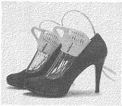
手軽に何にでも利用可能

い靴専用の 洗濯機「S teris hoer + (ステリシ ユー・プラ ス)」を販 売してい る。同商品 は、アメリ カを中心に