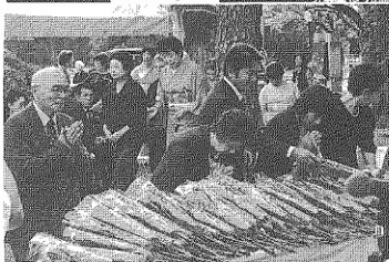
参列者による献花