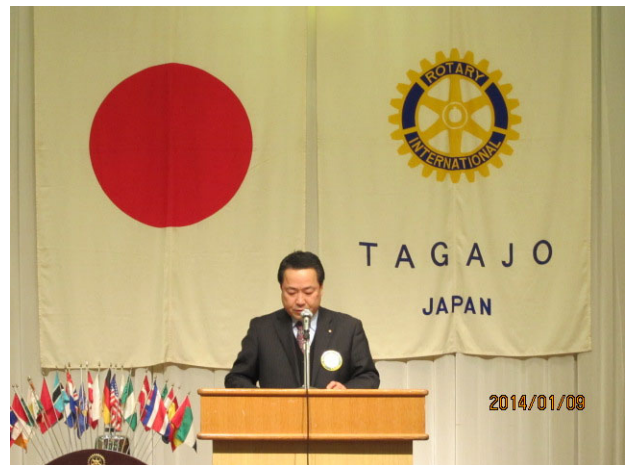
菅野幹事の年頭挨拶(スペースの関係で割愛させていただきます)