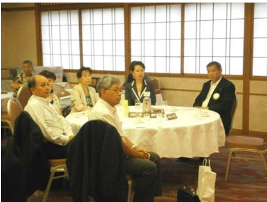
卓話に耳を傾ける3名の例会見学者